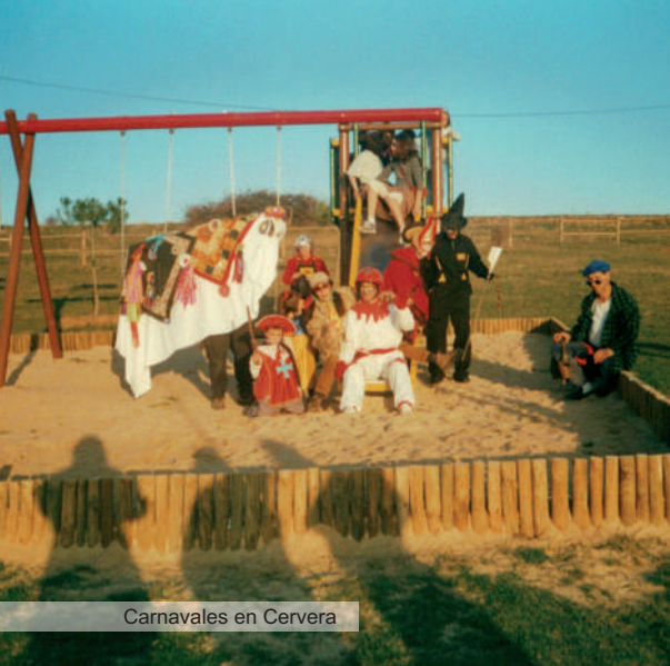
Carnavales en Cervera