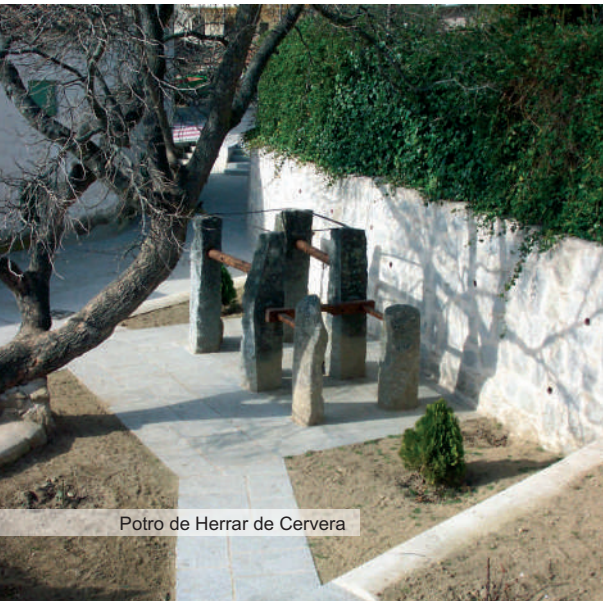
Potro de Herrar de Cervera

La actividad económica del pueblo se centró, como el resto de los municipios de la comarca, en la ganadería apoyada en la cabaña de cabras y ovejas churras. La tierra no era adecuada para la explotación agrícola, si bien existió una agricultura de subsistencia, dedicada a la producción de trigo y centeno fundamentalmente. La mayor parte de los terrenos, sin embargo, se