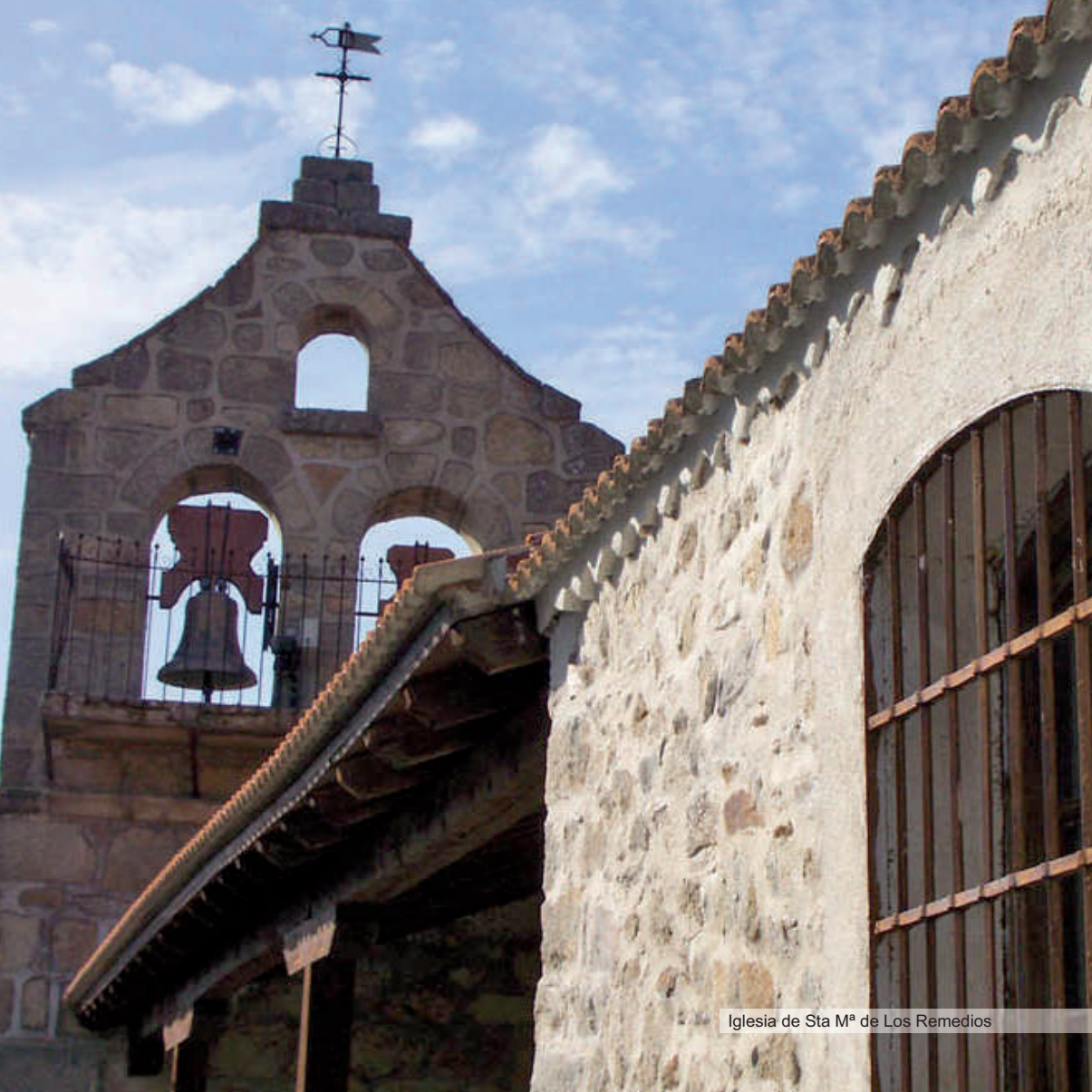
Iglesia de Sta Mª de Los Remedios